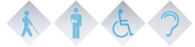
Eingliederung und Vermittlung Schwerbehinderte intensiv