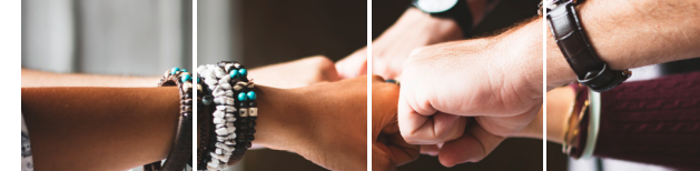
Stabilisierung einer Beschäftigungsaufnahme

Aufgrund der besseren Lesbarkeit wurde teilweise auf eine geschlechtsspezifische Schreibweise verzichtet. Selbstverständlich ist dieses Wiedereingliederungsangebot für Frauen und Männer gleichermaßen geeignet.