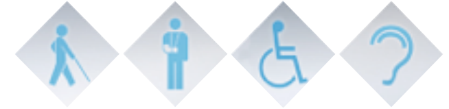
Eingliederung und Vermittlung Schwerbehinderte intensiv