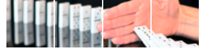
Eingliederung und Vermittlung Schwerbehinderte