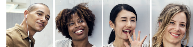
Bewerbungscoaching 100 mit berufsbezogenem Deutsch