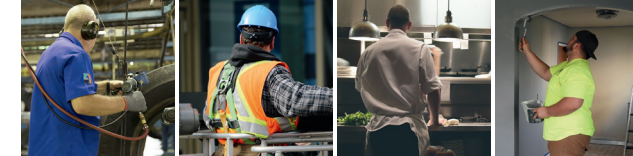
Mein beruflicher Neustart!