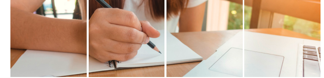
Stabilisierung einer Beschäftigungsaufnahme