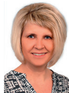
Ansprechpartnerin: Frau Meike Kirsten

Weitere Informationen erhalten Sie telefonisch unter 0991 402 200-40 und auf unserer Homepage unter www.peters-bg.de/deggendorf