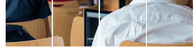
Betreute betriebliche Umschulung (BBU)